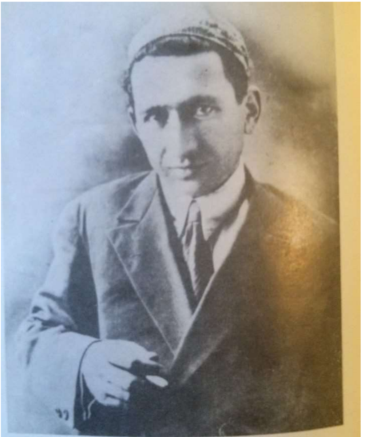
Եղիշե Չարեհց, 1929 թ.: