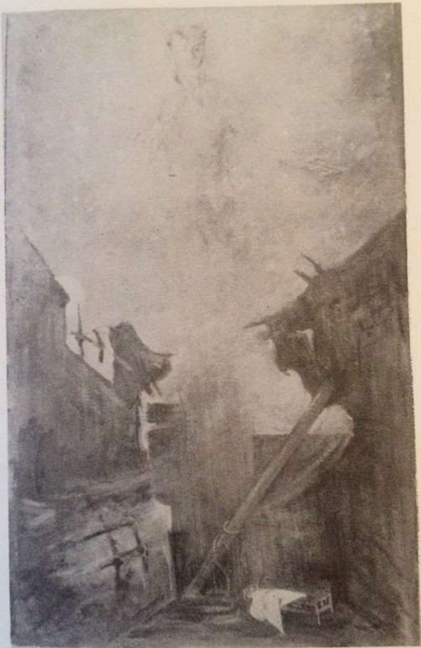
2.— «Դեպի հավերժություն»