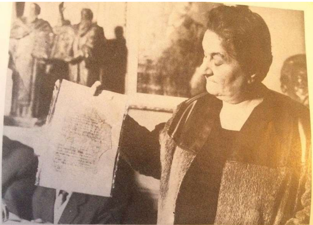
Ն. Չարենցի ձեռագրերի հանձնումը Ն. Չարենցի անվան գրականության և արվեստի թանգարանին, 1969 թ.: