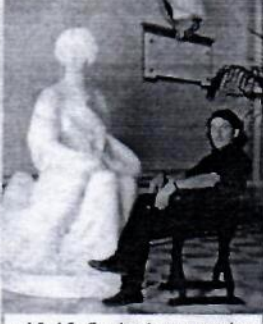
«Մ. Մ. Ֆրեսկոբալդի», Ֆլորենցիա, 2011 թ.

- Ձեր խորհուրդն այն պատանիներին, ովքեր հետաքրքրվում են արվեստի այս ճյուղով: