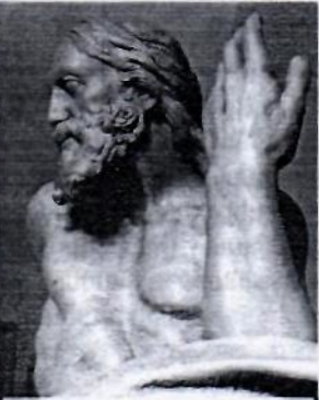
«Քրիստոս հարիավ ի մեռելոց» քանդակը, Ֆլորենցիա, Սբ. Ֆելիչե եկեղեցի, 2016 թ.