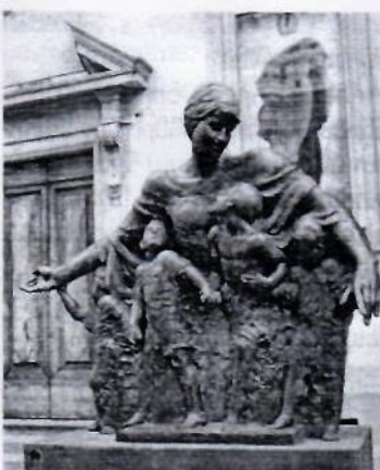
«Չայրոց մայր» հուշարձանը, Ֆլորենցիա, 2014 թ.

- Լավ քանդակագործ դառնալու համար նախ պետք է նվիրվել ամենացորդ: Դա նշանակում է մտնել մի աշխարհ, որն անվերջ ուսանելու աշխարհ է, այդ ճանապարհը կատարելագործումն է, որը անվերջ է, անսպառ է: Սակայն չկա ոչ մի երաշխիք, որ նվիրյալը կհասնի արդյունքի: Քանդակները կարող են մեծարվել Լուվրում կամ մոռացվել աղբարկղում: Արվեստում չկա միջինի հասկացողությունը: Քանդակագործի մասնագիտության մեջ հմտանալու համար անհրաժեշտ նախապայմաններն են՝ հավատ առ Քրիստոնեություն, աշխատասիրություն, համառություն, գիտելիքների իմացություն և իմաստություն, ուղերձ, որը ծնվում է անձի հմտության և երաժշտության համադրությամբ: Շատ կարևոր է նաև յուրացնել համաշխարհային արվեստի պատմությունը, ուսումնասիրել արվեստի բոլոր ճյուղերը, գործերը, նկարները, քանդակները: Կարևոր է լավ տիրապետել մայրենի լեզվին: Եվ, իհարկե, անհատական ճանապարհով հասնել վերջնական արդյունքի: