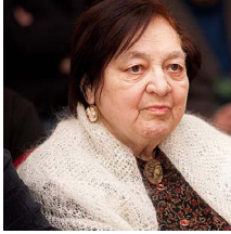
Իրինա Տոկմակովա (Իրինա-Արուսյակ Մանուկովա) (ծն. 03.03.1929)

Հայազգի ռուս մանկագիր, թարգմանիչ, մանկական և պատանեկան գրականության ասպարեզում Ռուսաստանի պետական մրցանակի դափնեկիր: Մանկական բանաստեղծությունների իր առաջին ժողովածուն՝ «Ծառերը», անմիջապես գրավել է ընթերցողին: Գրել է նաև վիպակներ, պատմվածքներ ու պիեսներ՝ «Գուցե զրոն մեղավոր չի», «Եվ կգա ուրախ առավոտը», «Ժենկա բվիկը», «Կախարդված սմբակը», «Ռոստիկը և Կեշան» և այլն: