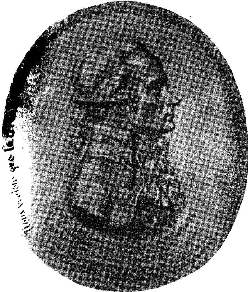
Մաֆսիսիան Ռոմեակիւր (բռնգե մեղալիւն՝ անհայտ վարպետի գործ)