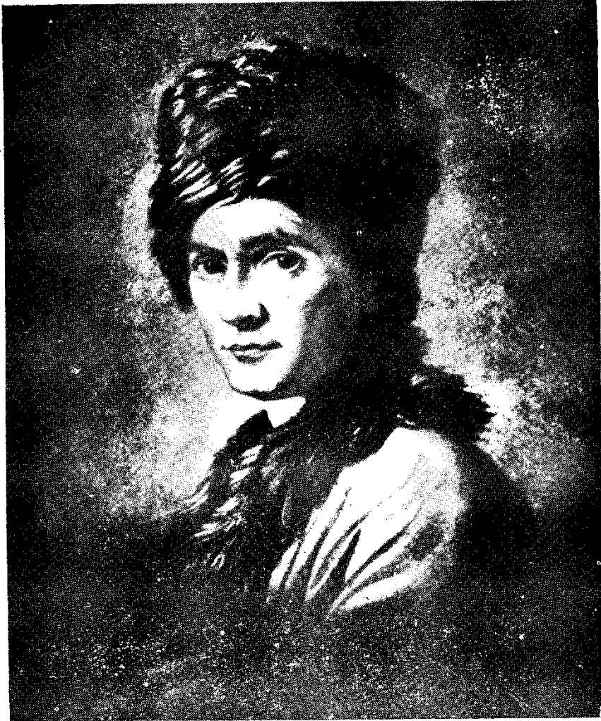
Ժան Ժակ Ռուսո