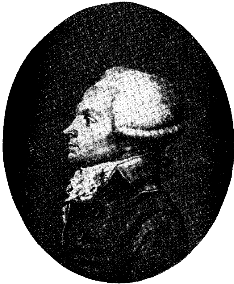
Ռոբեսպիեր (ժամանակակից փորագրանկար)