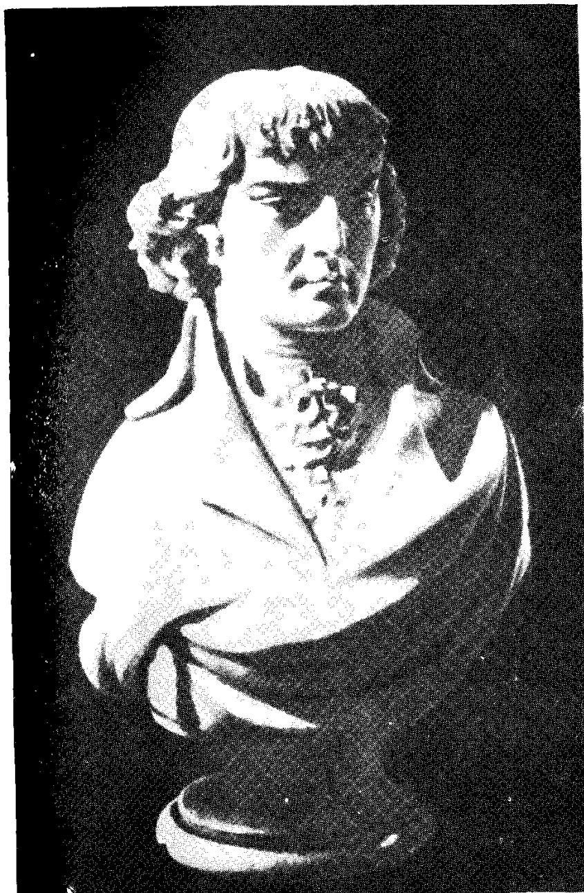
Անտուան Սեն-Յուստ (մարմարե կիսանդրի)