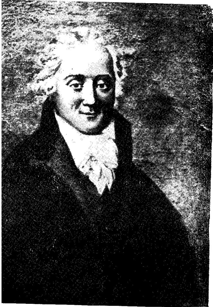
Ժորժ Կուտոն (ժամանակակից դիմանկար)