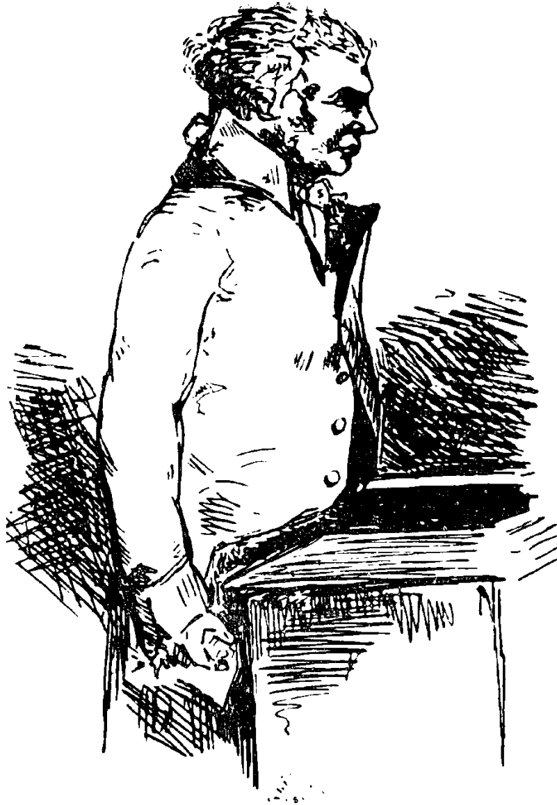
Ռոբեսպիերը Կոնվենտի ամբիանի վրա (ժամանակակից նկար)