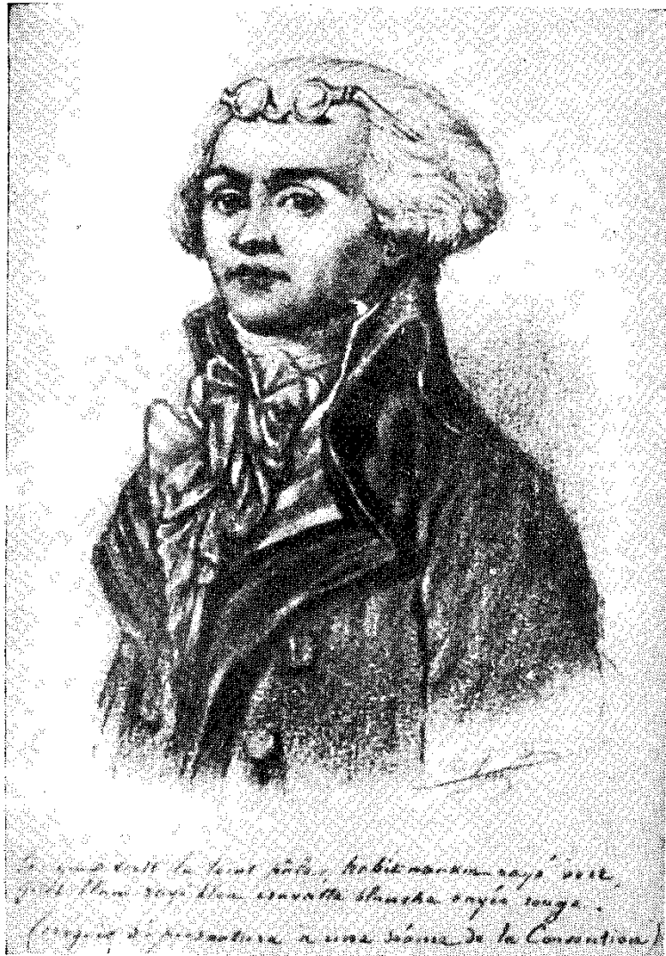
Ռոբեսպիեր (ժամանակակից նկար)