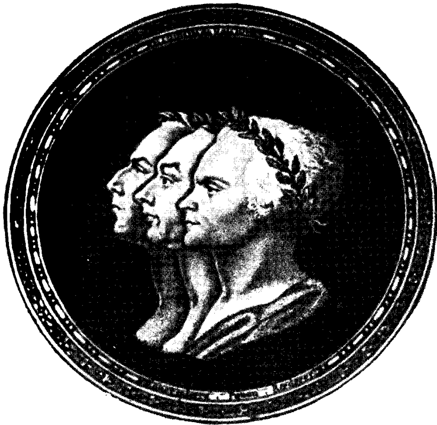
Սահմանադիր ժողովի հայրենասիրական հռապետու- քյուն՝ Ռեդեեր-Պետրոն-Ռոբեսպիեր (ժամանակա- կից փորագրանկար)