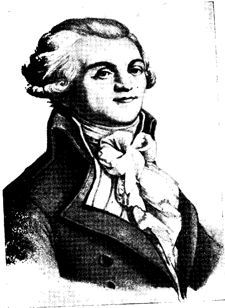
Մորեսսինե (Պեյպլեշի փոռադամկար)