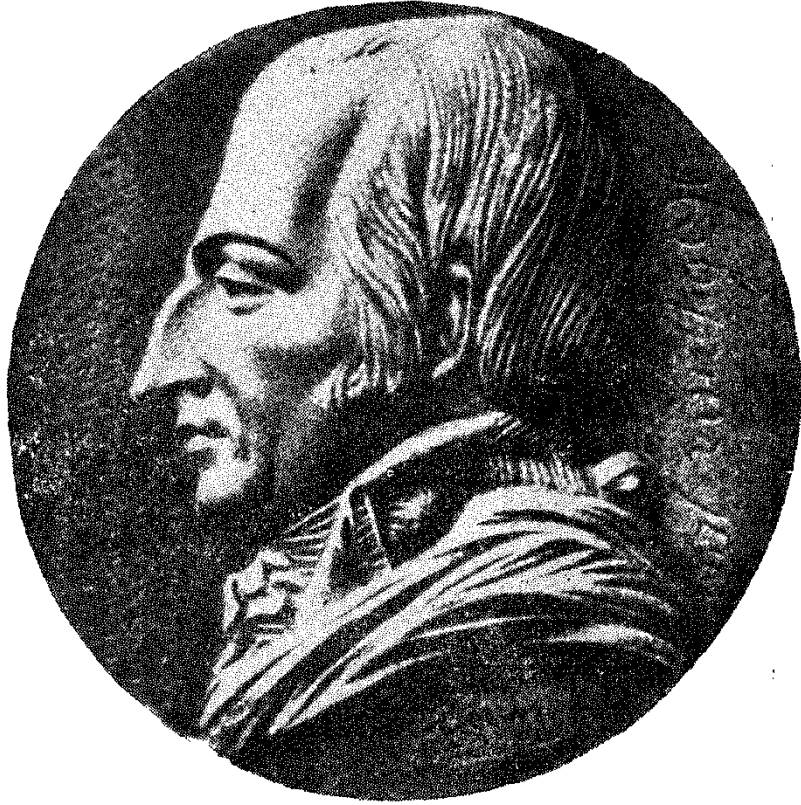
Օգյուստեն Ռոբեսպիեր: Մեղադրոն՝ գործ Դավիդ դ'Անժևի: