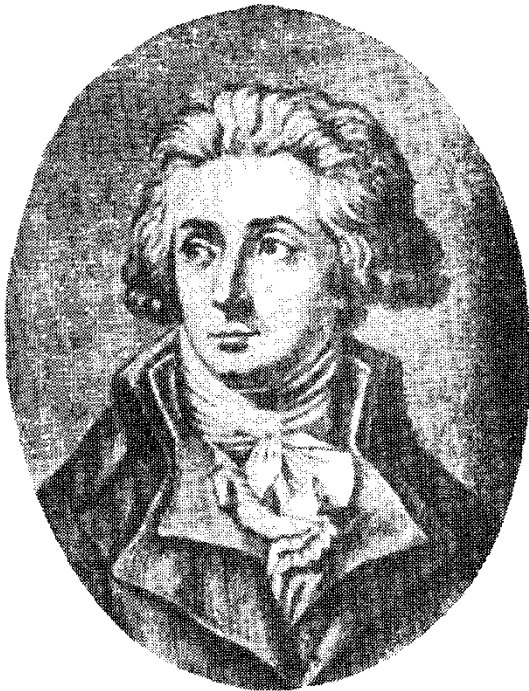
Էրո դը Սեշալ