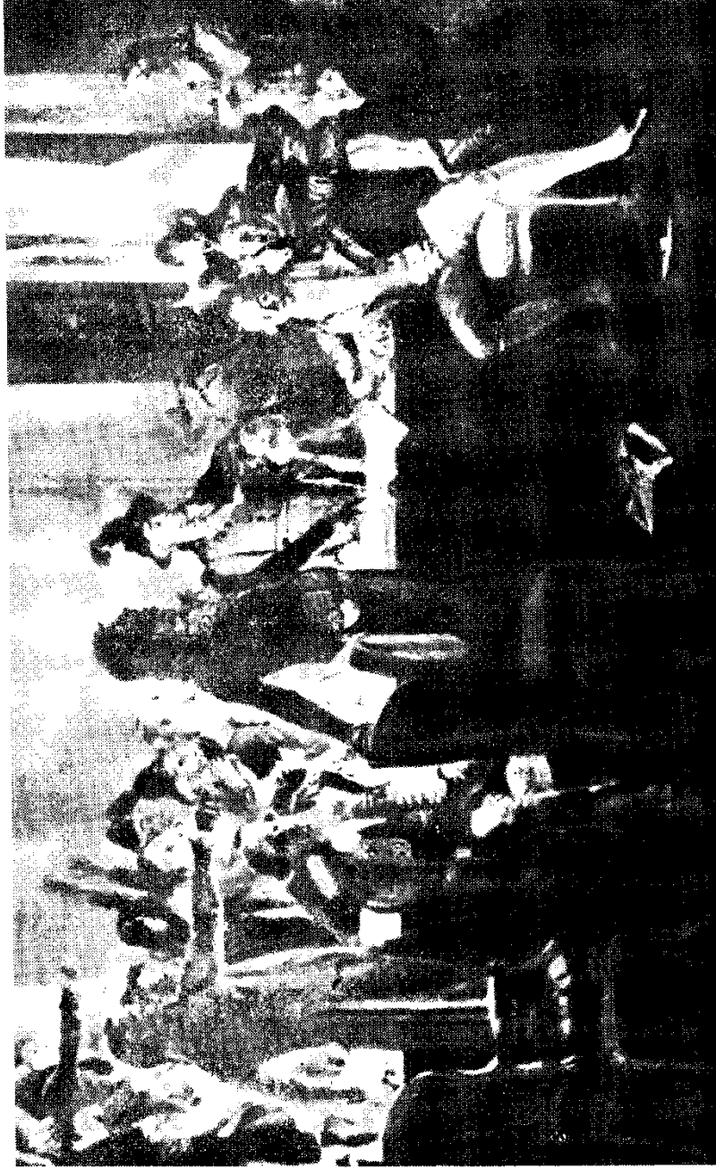
Տեղիորդի լույս 10-ի գիշերը